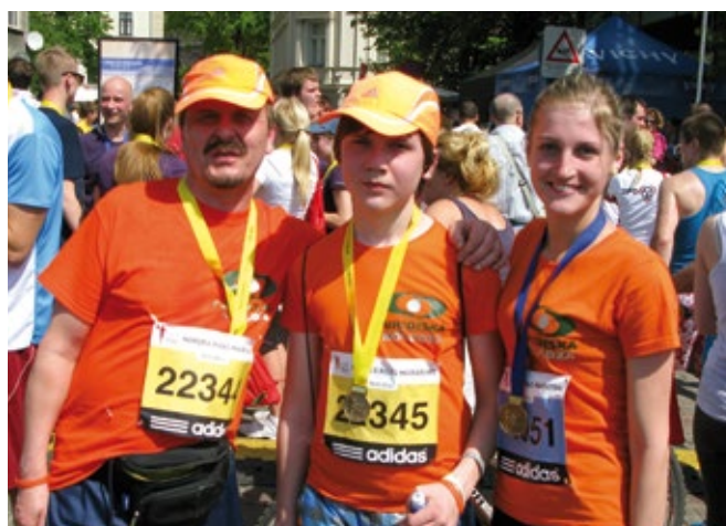
Nordea Rīgas maratonā 2014. gada 18. maijā piedalījās 10 mūsu studenti. Divi drosminieki veica pusmaratonu, trīs skrējēji par piemērotāko bija izvēlējušies 10 km posmu, bet pārējie - skatītāju un līdzjutēju uzmundrināti - rītā soli veica piecu kilometru distanci pa pilsētas ielām.