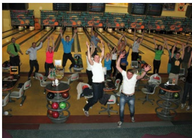
Starptautiskā zinātnes nedēļa 26. aprīļa pēcpusdienā noslēgta ar Juridiskās koledžas organizēto boulinga turnīru. Zelta boulinga centrā uz rezervētajiem 13 zāles ceļiņiem spēkiem mērojās studentu komandas no Rīgas, Liepājas un Gulbenes filiālēm, kā arī absolventi, mācībaspēki un darbinieki.