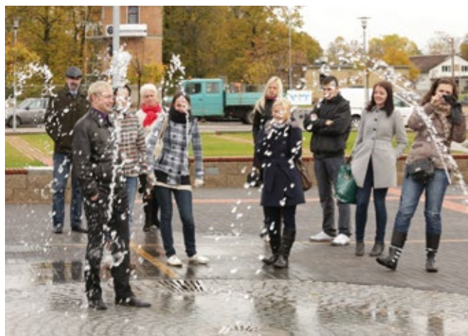
Studentu pašpārvaldes organizētā dienas nodalās studentu un docētāju ekskursija uz Siguldū un Līgatni.