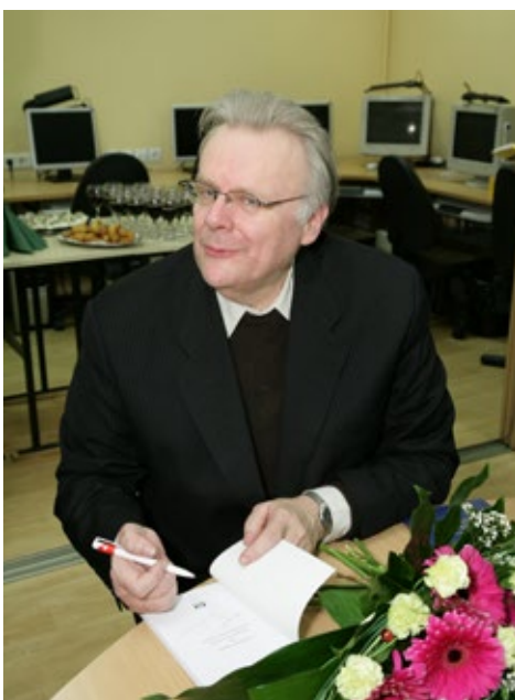
Raksta autors savas grāmatas „Lisabonas līgums un Eiropas Savienības konstitucionālie pamati” atvēršanas svētkos

Juridiskā koledža sadarbībā ar Konfliktu risināšanas un mediācijas biedrību organizē